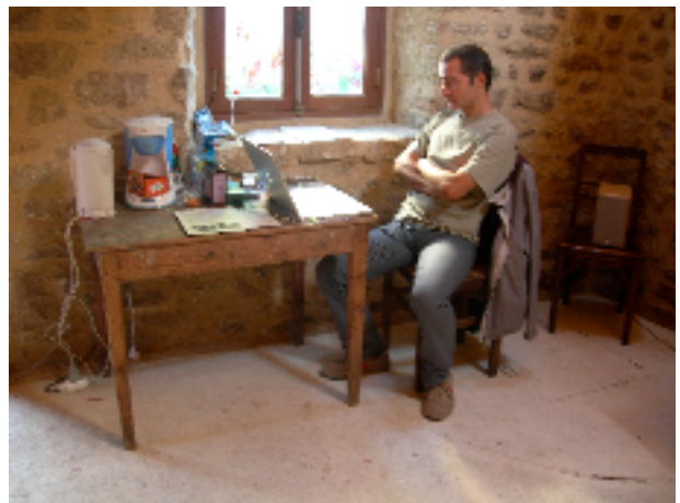
Un artiste en action.

Nocturnes: vendredi 5 août , pour cause de Superman , la résidence ne sera pas ouverte le matin mais l'après-midi de 16h30 à 19 heures et le soir de 21h à minuit .