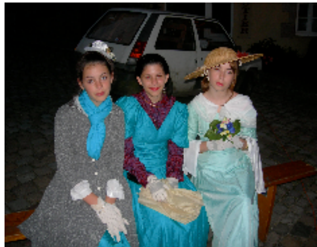
Trois graces assistant à “La Règle du jeu”.